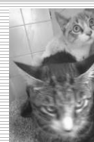
Gatinhos ninhada com 5 meses.