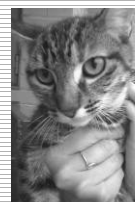
Gata, muito dócil, 10 meses;