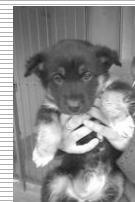
Cachorro, cruzado Pastor, 2 meses;

Se pretende adoptar um animal sem dono veja os disponíveis no Centro Veterinário Municipal.