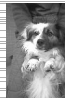
Cachorro, cruzado indef., 8 meses;