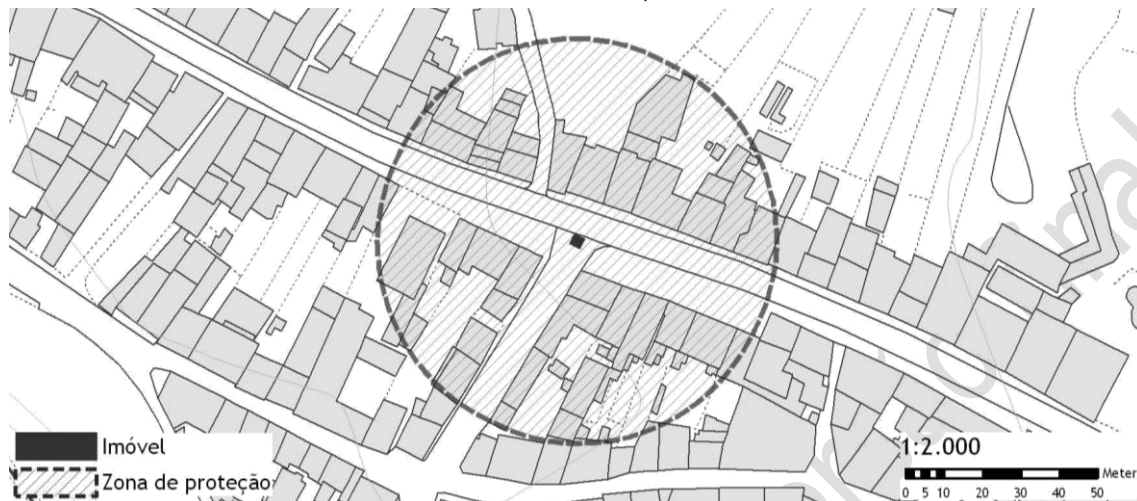
Figura 2 Imóvel de Interesse Público – Casa do Anjo de São Miguel (Decreto 29/84, DR 145, de 25-06-1984)