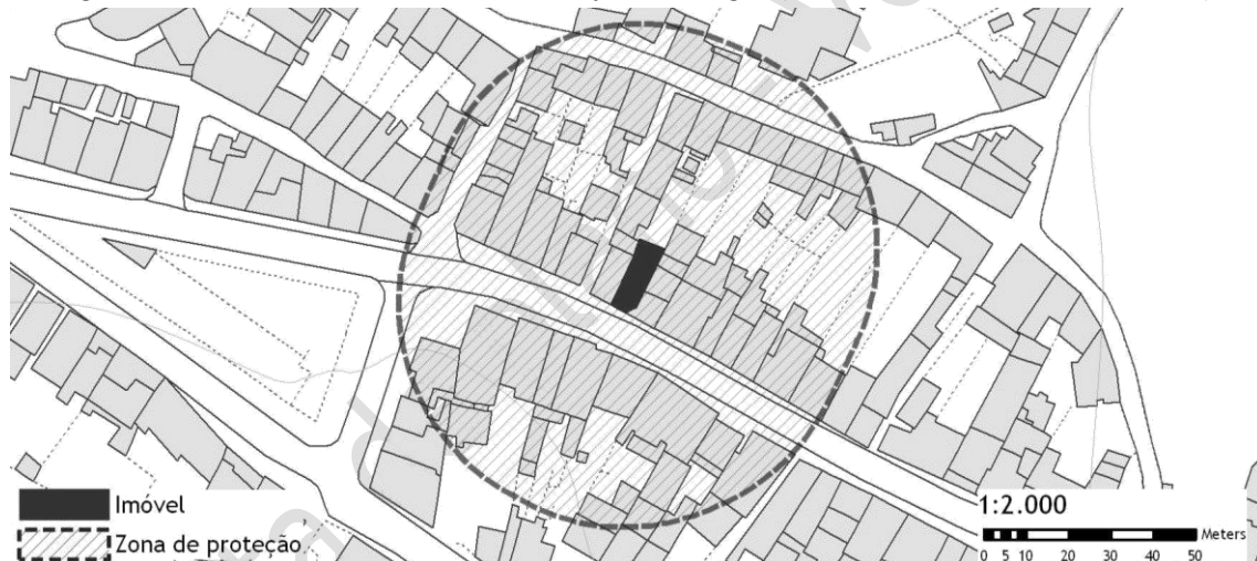
Figura 3 Imóvel de Interesse Municipal – Ponte de São Lázaro/ Pina (Decreto 129/77, DR 226, de 29-09-1977)