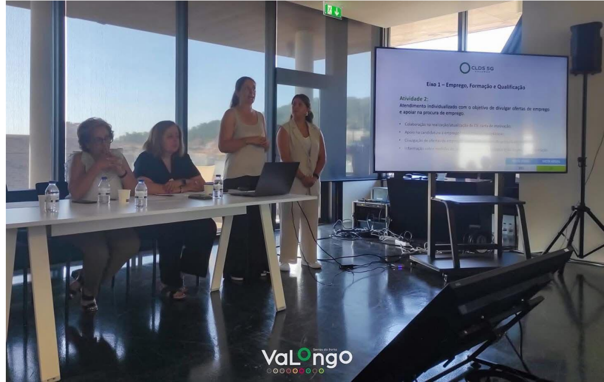
Apresentação do Projeto CLDS5G VALONGO na reunião de CLAS (07/07/2025)