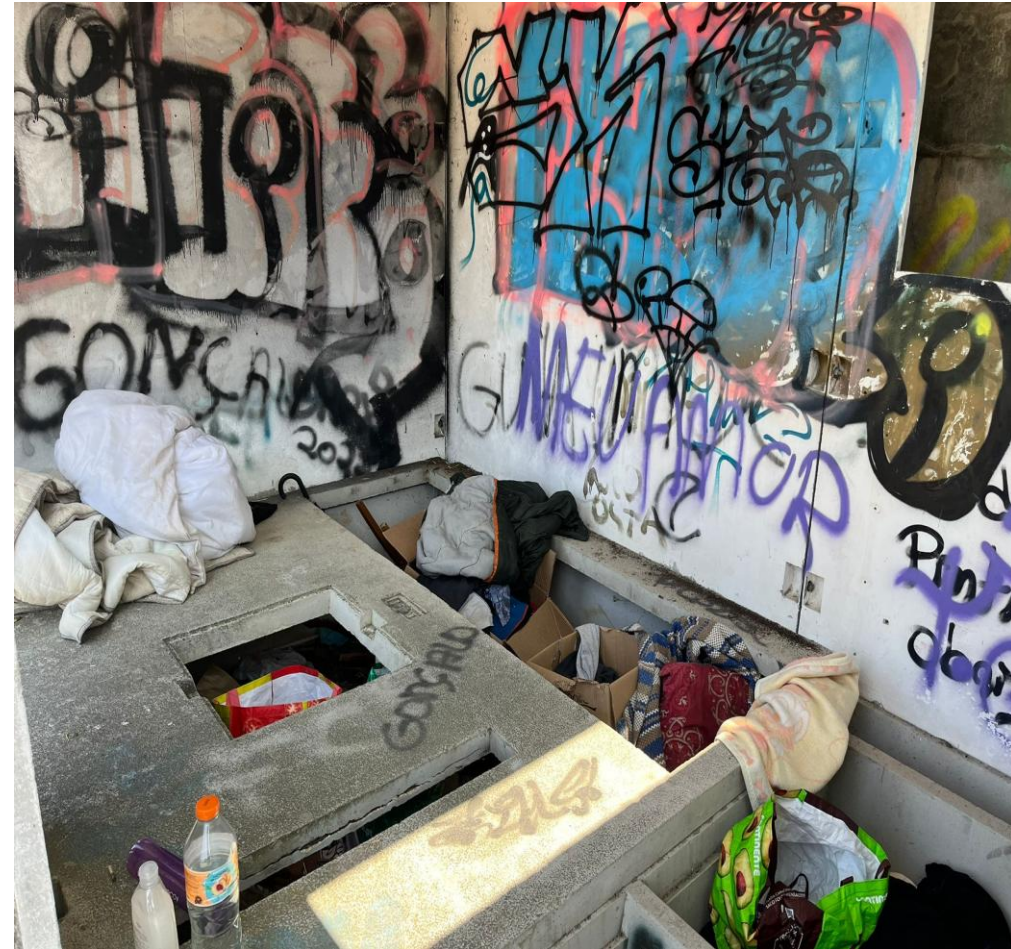
Atividade 12 – mediação intercultural e social a migrantes em situação de sem-abrigo