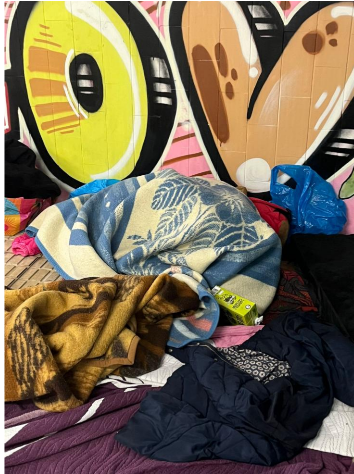
Atividade 10 - acompanhamento social com vista à inserção social