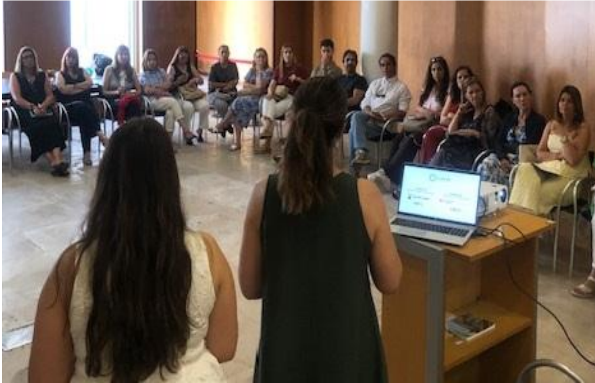
Apresentação do Projeto CLDS5G VALONGO aos técnicos/as de intervenção social do concelho de Valongo (12/06/2025)