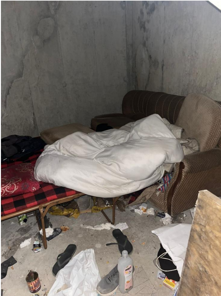
Atividade 8 – ação de âmbito social (idas a locais de pernoita das pessoas em situação de sem-abrigo)