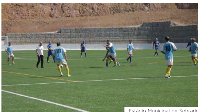
Estádio Municipal de Sobrado

“Está em causa o interesse público que não pode ficar refém de interesses privados. É nossa obrigação defender o Desporto no concelho”, sublinha o Presidente da Câmara Municipal de Valongo.