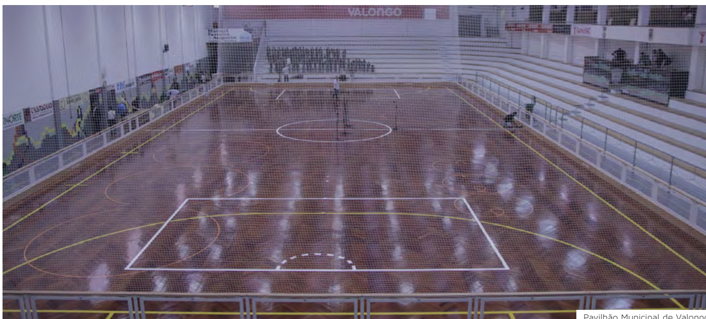
Pavilhão Municipal de Valongo