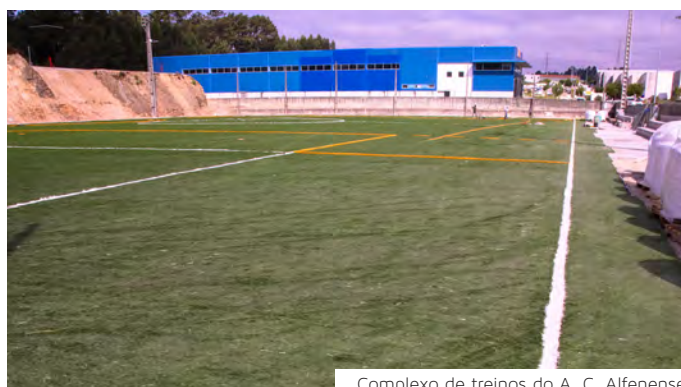
Complexo de treinos do A. C. Alfenense