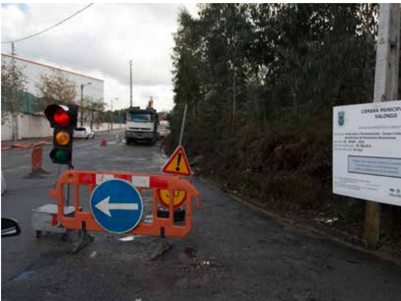
▲ Beneficiação de arruamentos na Zona Industrial de Campo