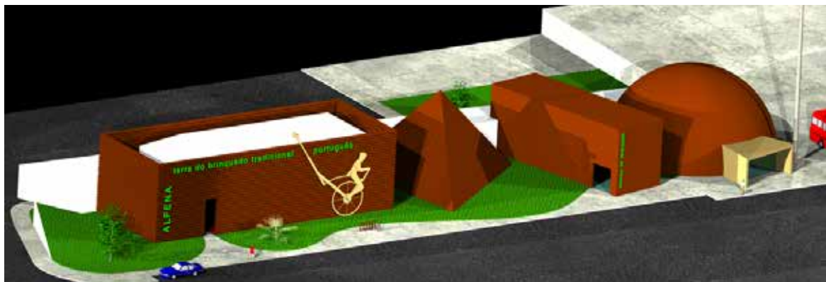
▶ Oficina do Brinquedo Tradicional Português – Alfena