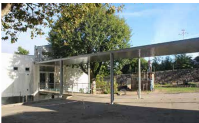
▲ Nova cobertura na Escola da Costa – Ermesinde