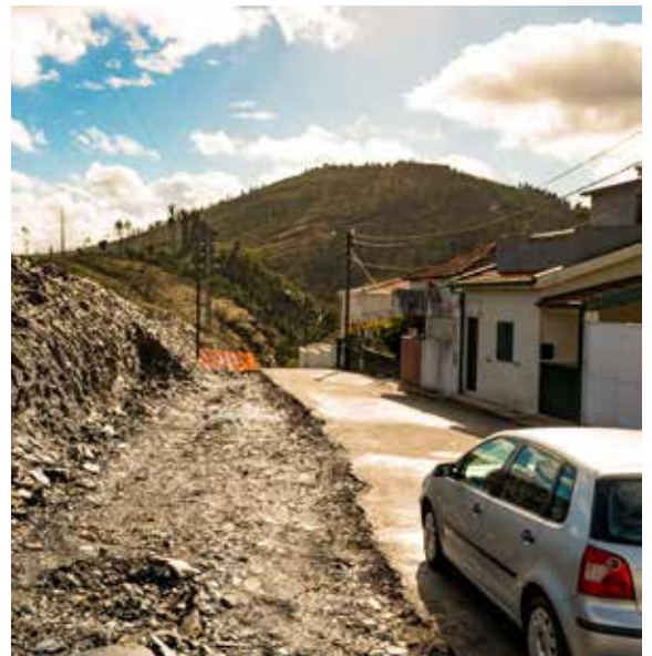
▲ Alargamento da Rua de São João (Azenha) - Campo