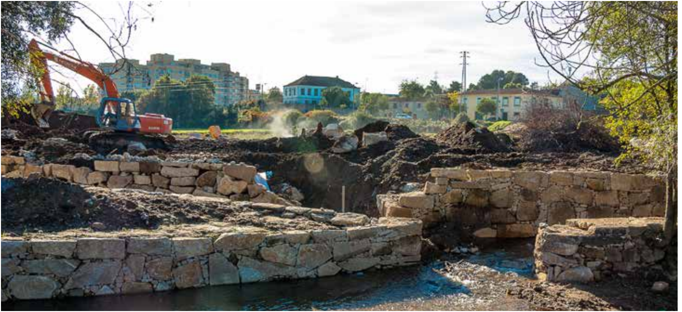
▲ Recuperação das margens do Rio Leça e Levada do Cabo - Alfena