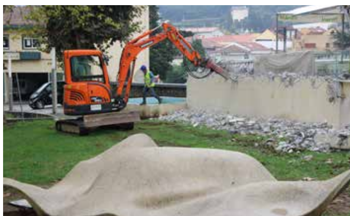
▲ Reabilitação do Largo do Centenário – Valongo