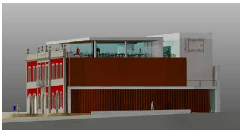
▲ Oficina de promoção da Regueifa e do Biscoito – Valongo