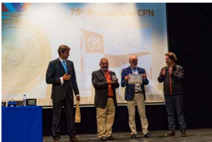
▲ CPN - Clube de Propaganda da Nataçã

O Sporting Clube de Campo é um dos mais antigos clubes desportivos do Concelho de Valongo. O clube, que tem como principal objetivo a prática do futebol, foi fundado em fevereiro de 1931, tendo comemorado em 2016 o seu 85º Aniversário. O SC Campo tem uma vasta história ligada à prática do futebol com jogos que atraíam muita gente. Este clube teve durante todos estes anos um papel importante na formação e desenvolvimento das crianças e jovens que fizeram parte das equipas de formação deste clube.