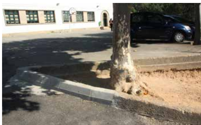
▲ Melhoramentos na Escola da Balsa – Sobrado