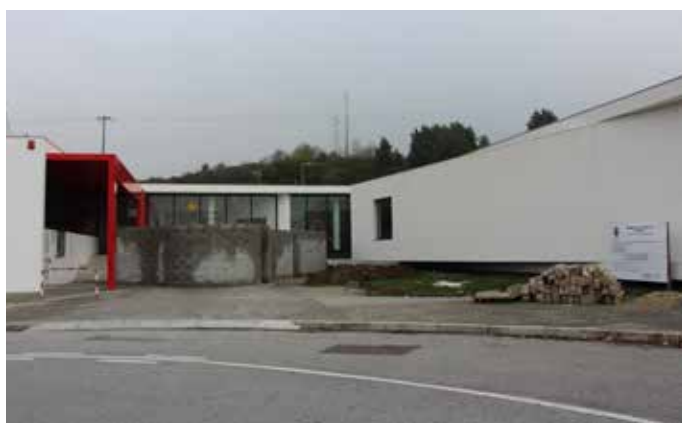
▲ Reformulação da Entrada da Escola da Estação – Valongo