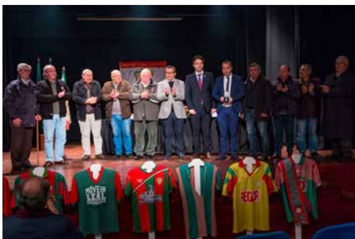
▲ Sporting Clube de Campo