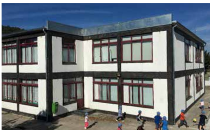
▲ Requalificação da Escola da Azenha – Campo

postos pelo PAEL, a Autarquia está também a promover um conjunto significativo de obras em prol da qualidade de vida da população de todas as freguesias. Destacam-se os investimentos nos arruamentos estruturantes e espaços públicos.