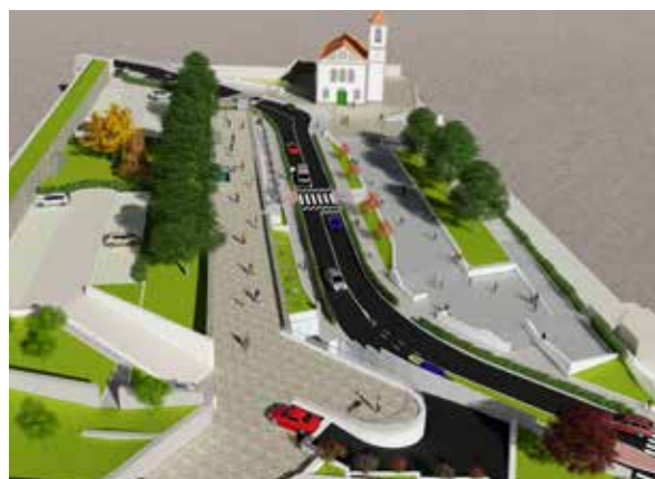
▲ Centro Cívico de Campo