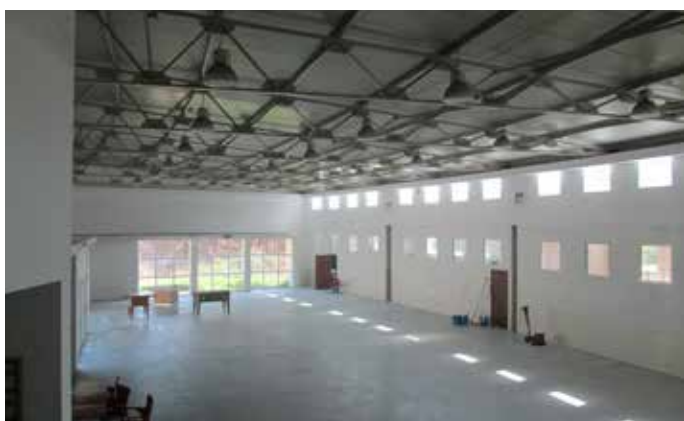
▲ Intervenção na Escola Profissional de Valongo – Sobrado