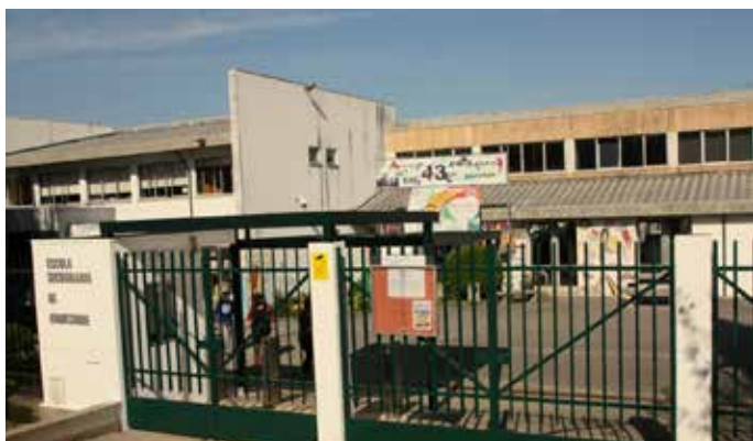
▲ Requalificação da Escola Secundária de Ermesinde

Verifica-se ainda a promoção das marcas identitárias do concelho com a concretização de iniciativas de carácter cívico, cultural, recreativo e desportivo, com repercussões positivas na economia local a par da estratégia de contenção da despesa para reforço e consolidação das finanças municipais e redução da dívida total.