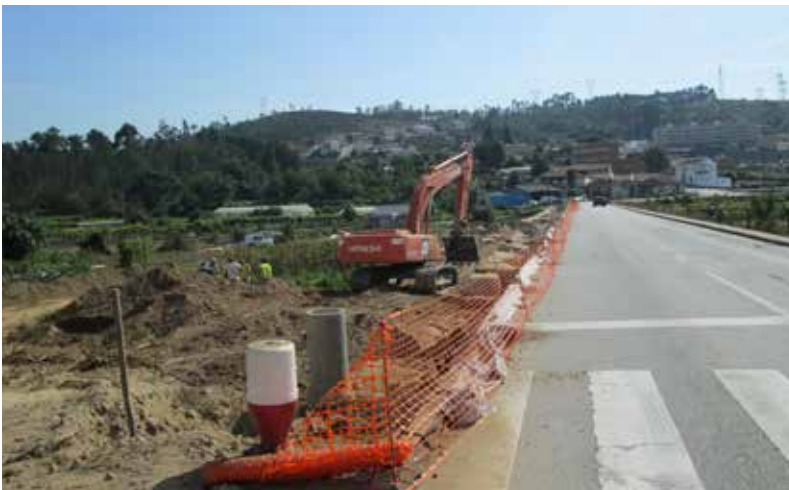
▲ Intervenção na Rua de São Vicente - Alfena