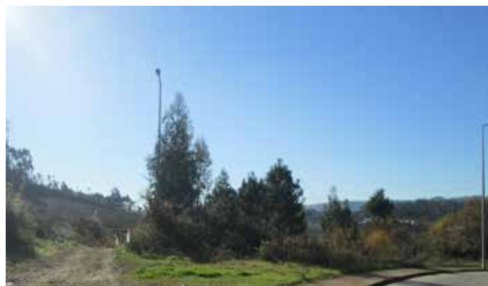
▲ Ligação Gandra-Costa – Sobrado