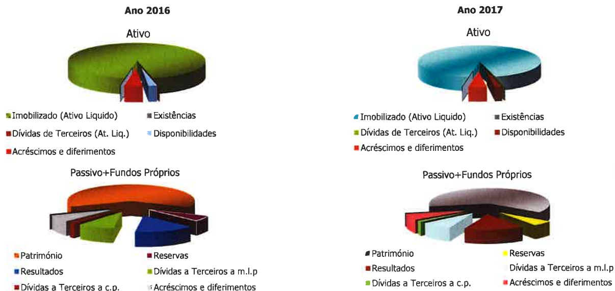
FIGURA Nº 1