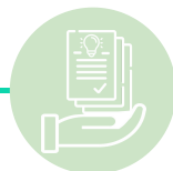
ETAPA 3: PROPOSTAS