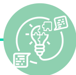
ETAPA 4: AÇÕES EXPERIMENTAIS ESTAMOS AQUI!