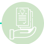
ETAPA 3: PROPOSTAS