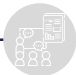
ETAPA 5: APRESENTAÇÃO PÚBLICA DO PDM

Inscrições pelo formulário em https://www.cm-valongo.pt/p/pdm2020