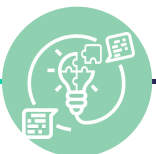
ETAPA 4: AÇÕES EXPERIMENTAIS ESTAMOS AQUI!