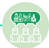
ETAPA 2: DIAGNÓSTICO