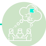
ETAPA 1: EXPECTATIVAS