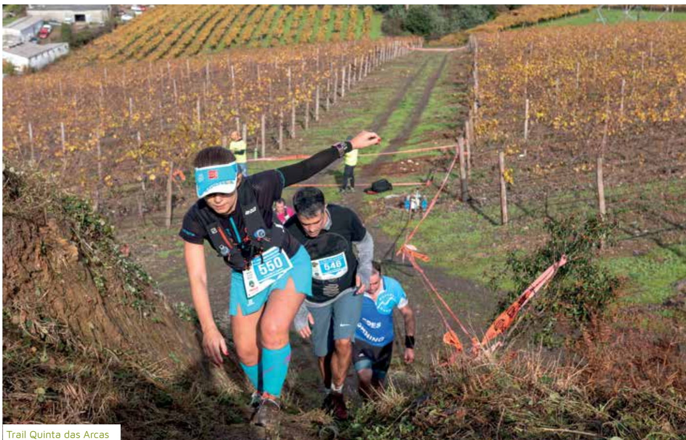
Trail Quinta das Arcas