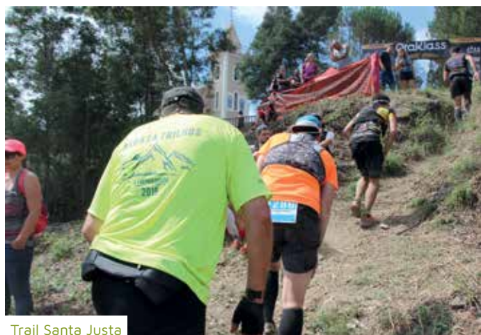
Trail Santa Justa