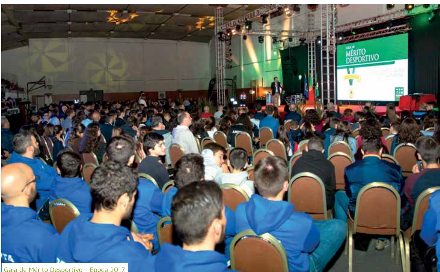
Gala de Mérito Desportivo - Época 2017