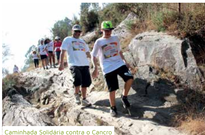
Caminhada Solidária contra o Cancro