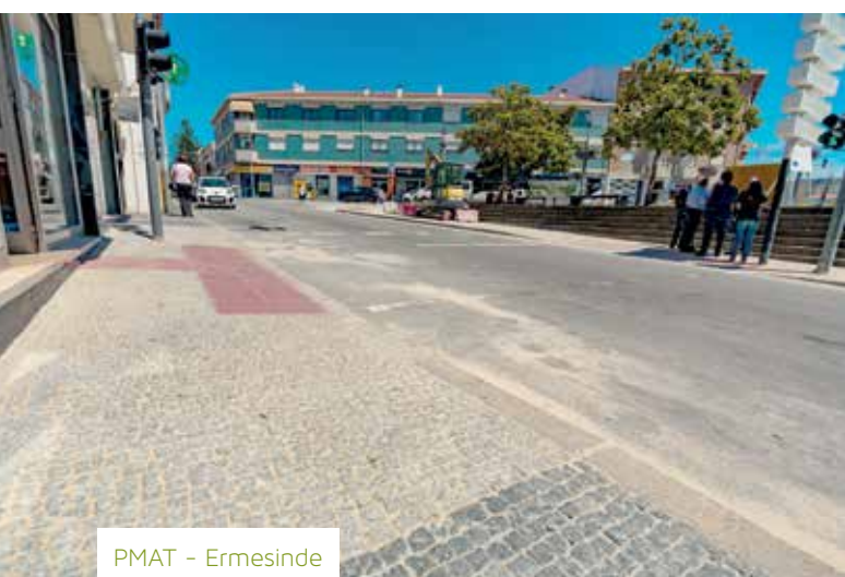
PMAT - Ermesinde