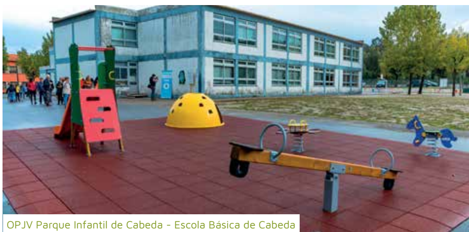
OPJV Parque Infantil de Cabeda - Escola Básica de Cabeda