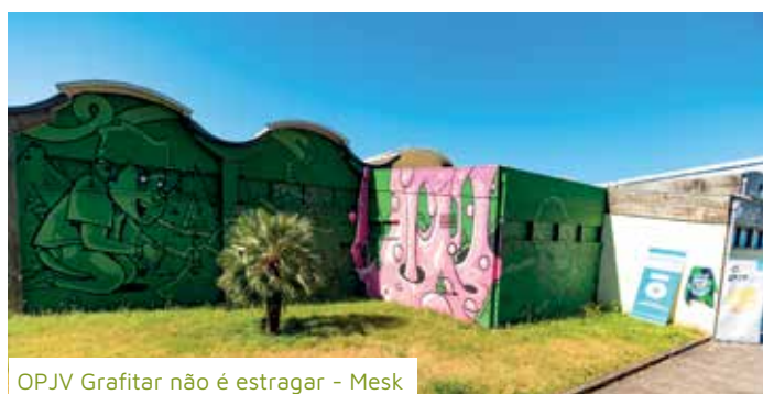
OPJV Grafitar não é estragar - Mesk