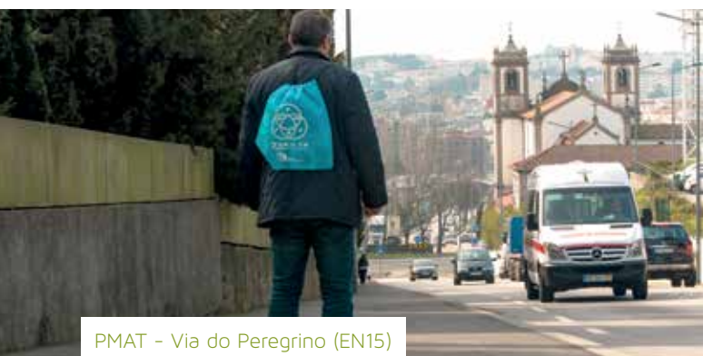
PMAT - Via do Peregrino (EN15)