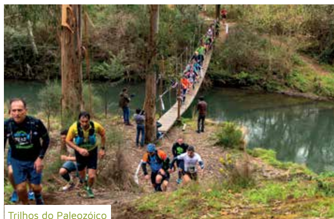
Trilhos do Paleozóico