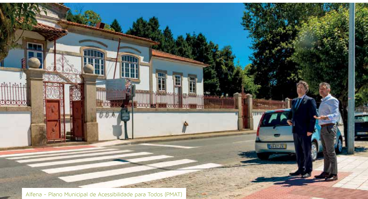
Alfena - Plano Municipal de Acessibilidade para Todos (PMAT)