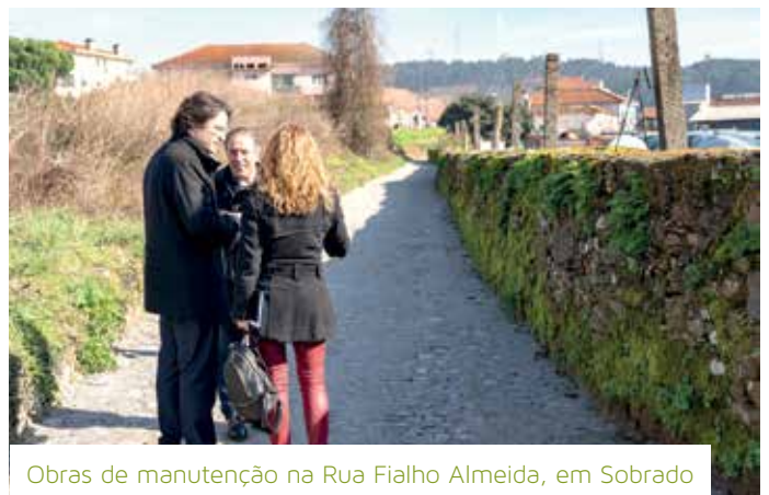
Obras de manutenção na Rua Fialho Almeida, em Sobrado