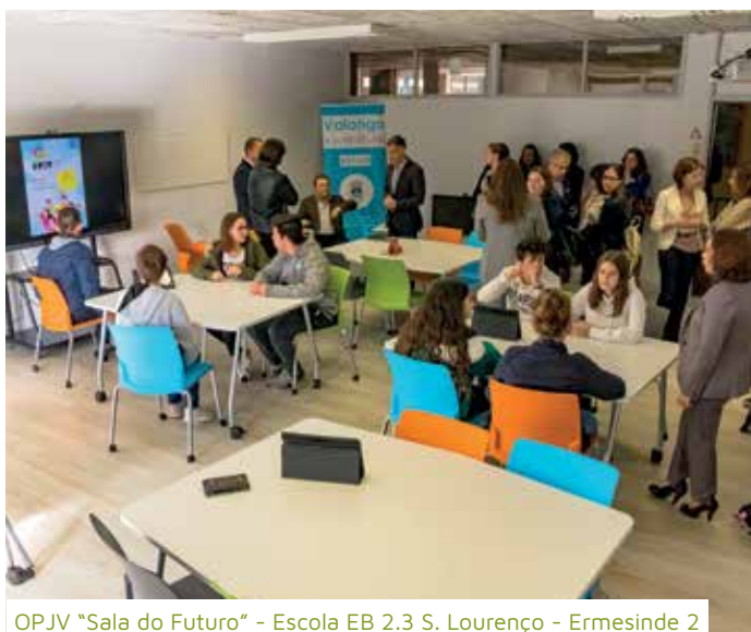
OPJV "Sala do Futuro" - Escola EB 2.3 S. Lourenço - Ermesinde 2