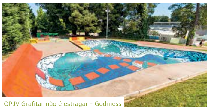
OPJV Grafitar não é estragar - Godmess