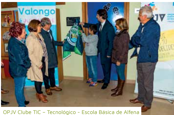
OPJV Clube TIC – Tecnológico – Escola Básica de Alfena