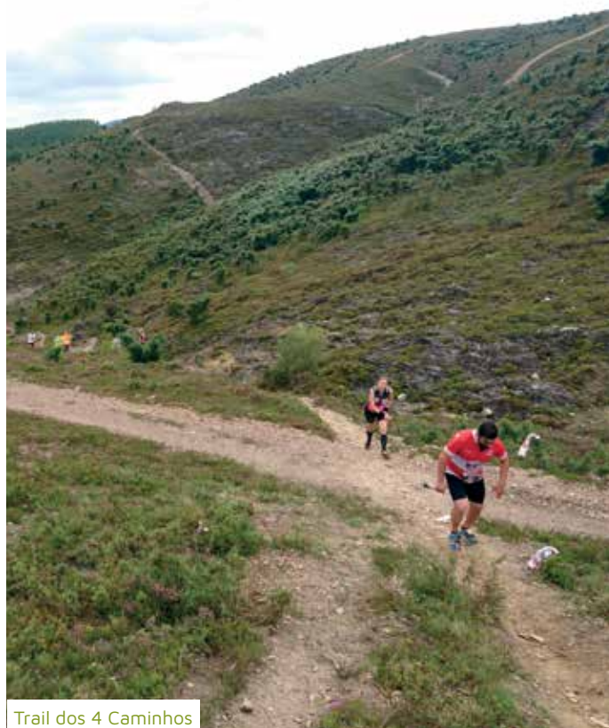
Trail dos 4 Caminhos

Os melhores atletas são anualmente reconhecidos nas Galas de Mérito Desportivo e do Circuito trilhos de Valongo.