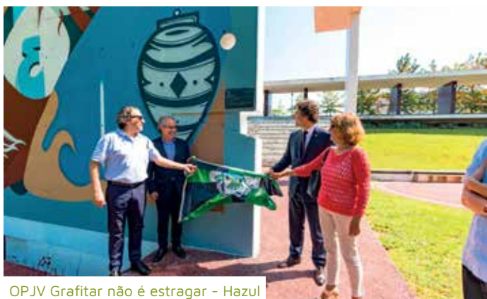
OPJV Grafitar não é estragar - Hazul