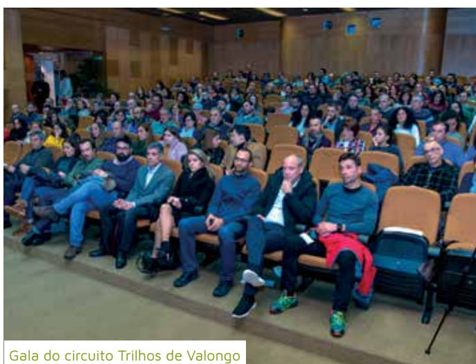
Gala do circuito Trilhos de Valongo