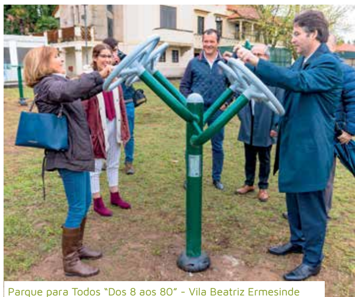
Parque para Todos "Dos 8 aos 80" - Vila Beatriz Ermesinde