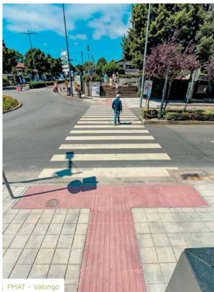
PMAT - Valongo