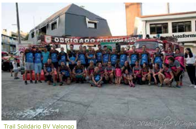
Trail Solidário BV Valongo