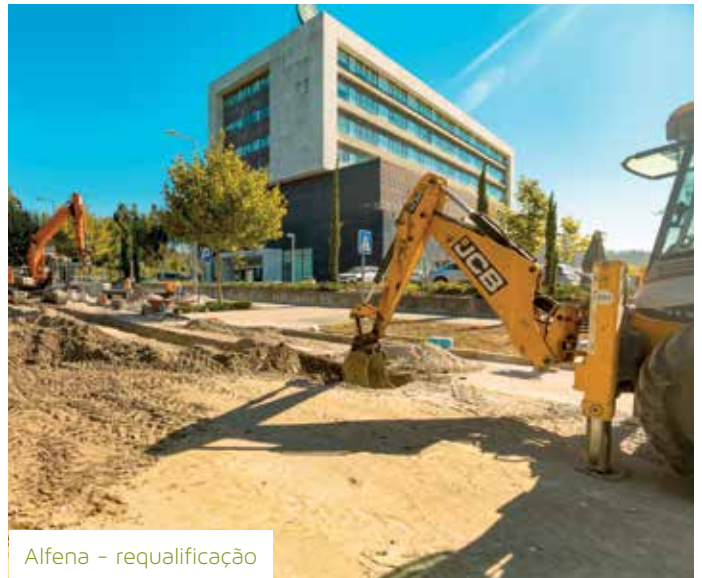
Alfena - requalificação