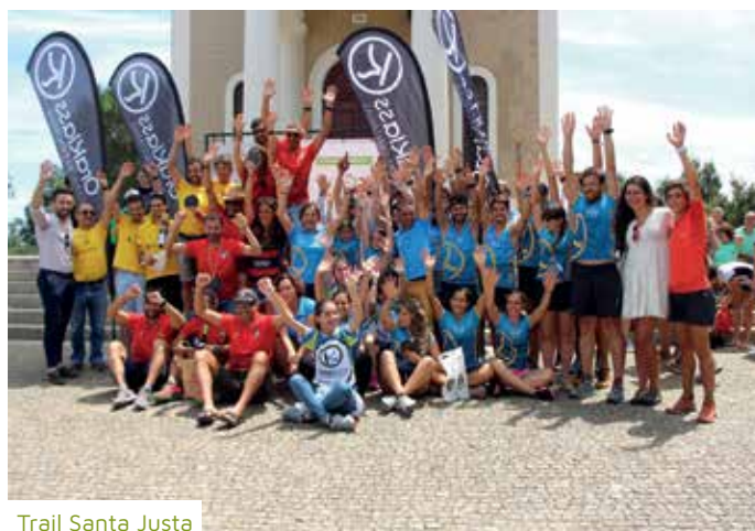
Trail Santa Justa