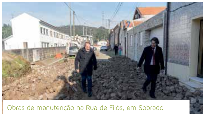
Obras de manutenção na Rua de Fijós, em Sobrado