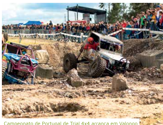
Campeonato de Portugal de Trial 4x4 arranca em Valongo