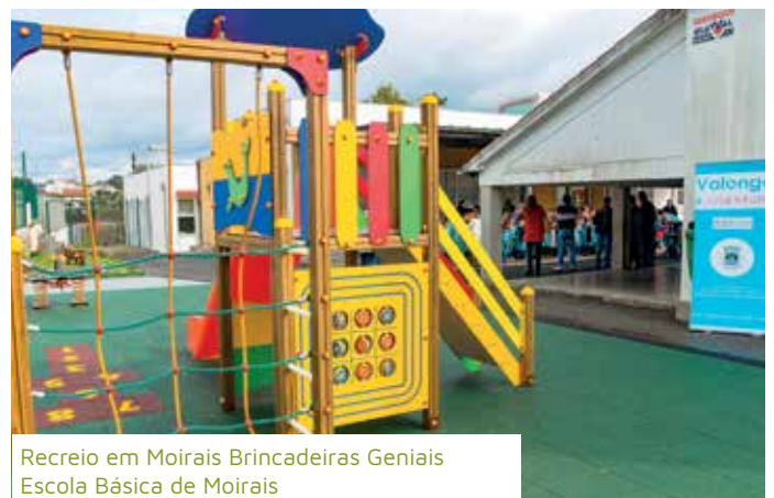
Recreio em Moirais Brincadeiras Geniais Escola Básica de Moirais