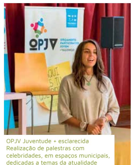
OPJV Juventude + esclarecida Realização de palestras com celebridades, em espaços municipais, dedicadas a temas da atualidade