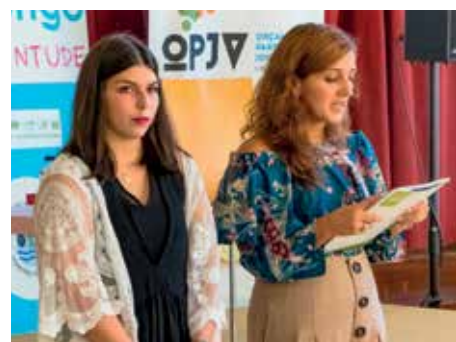
OPJV Projecto(ME) – Mais Emprego Serviço especializado em desenvolvimento pessoal e gestão de carreira