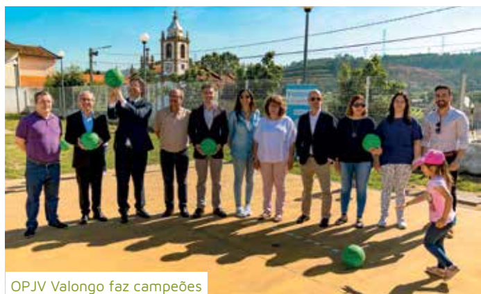
OPJV Valongo faz campeões