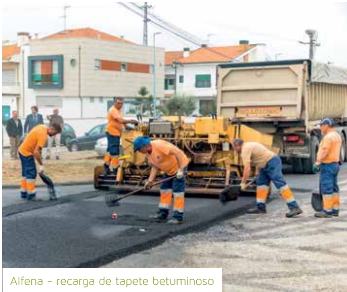
Alfena - recarga de tapete betuminoso