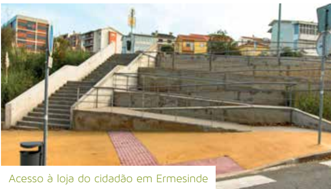
Acesso à loja do cidadão em Ermesinde