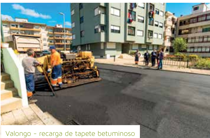
Valongo - recarga de tapete betuminoso