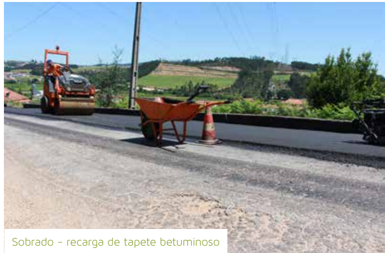
Sobrado - recarga de tapete betuminoso