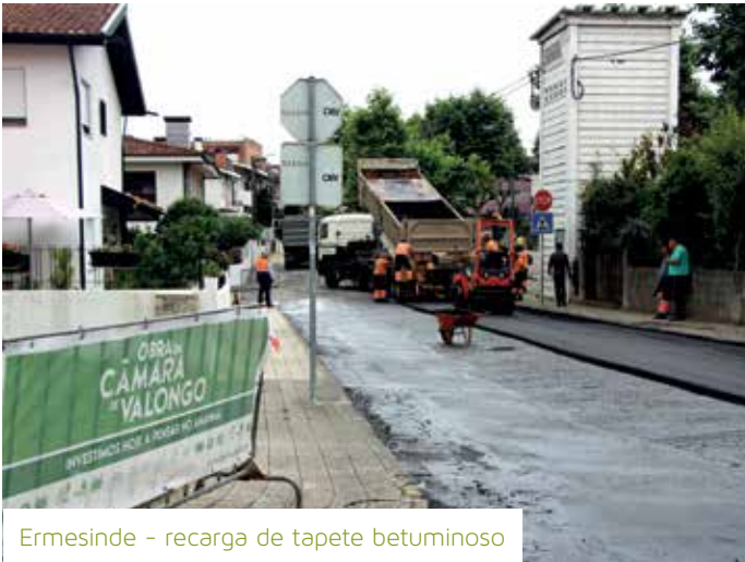
Ermesinde - recarga de tapete betuminoso