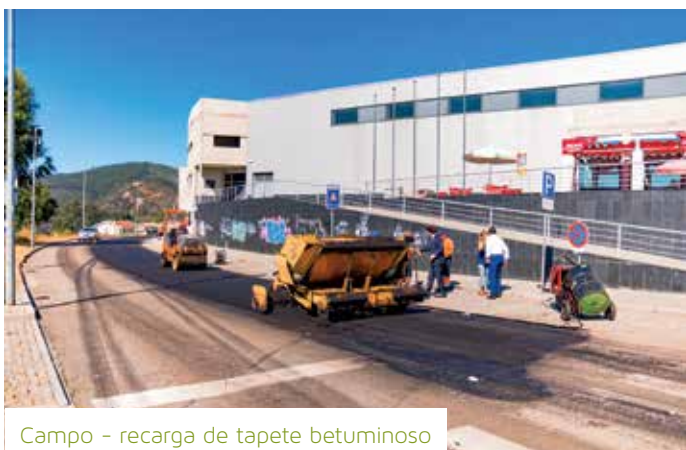
Campo - recarga de tapete betuminoso

Também com recurso a fundos comunitários, estão a ser realizadas obras de requalificação dos empreendimentos municipais, designadamente nas urbanizações de Sampaio em Ermesinde e de Balselhas em Campo do Valado, em Valongo e de São Bartolomeu, em Alfena.