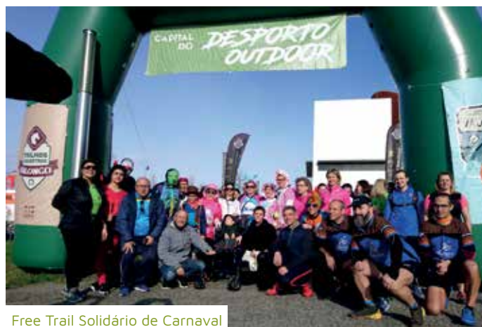
Free Trail Solidário de Carnaval