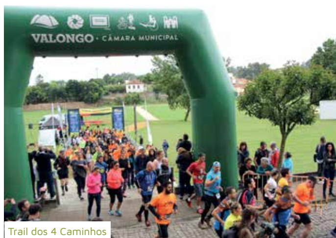
Trail dos 4 Caminhos