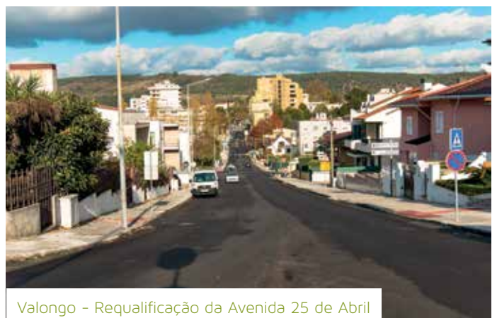
Valongo - Requalificação da Avenida 25 de Abril