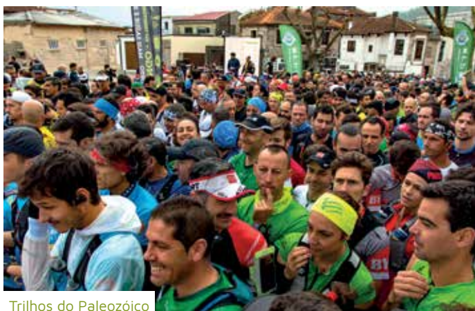
Trilhos do Paleozóico