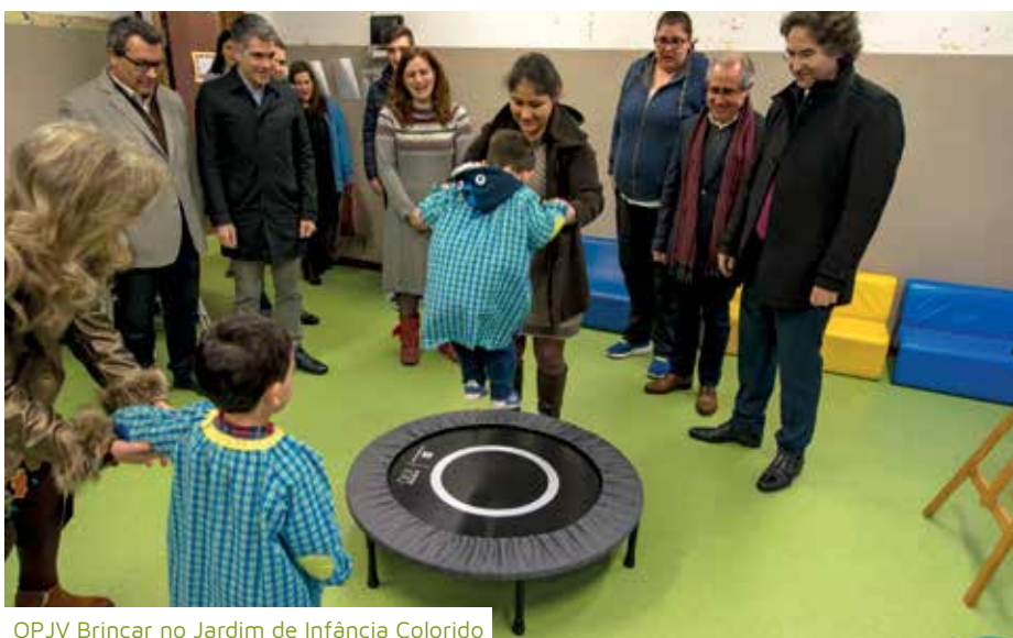
OPJV Brincar no Jardim de Infância Colorido