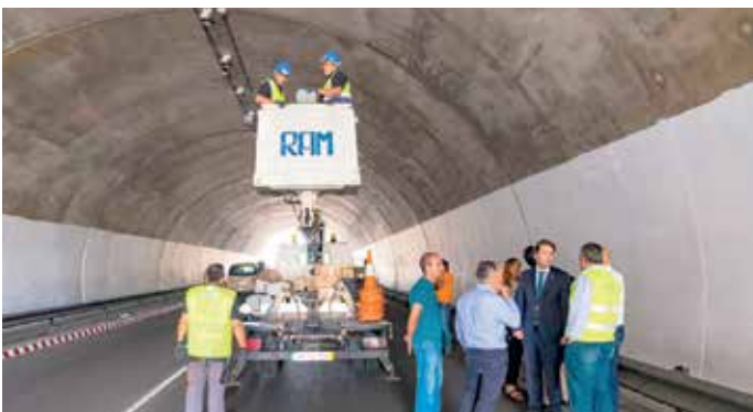
Limpeza e instalação de iluminação LED no Túnel da Costa Ermesinde