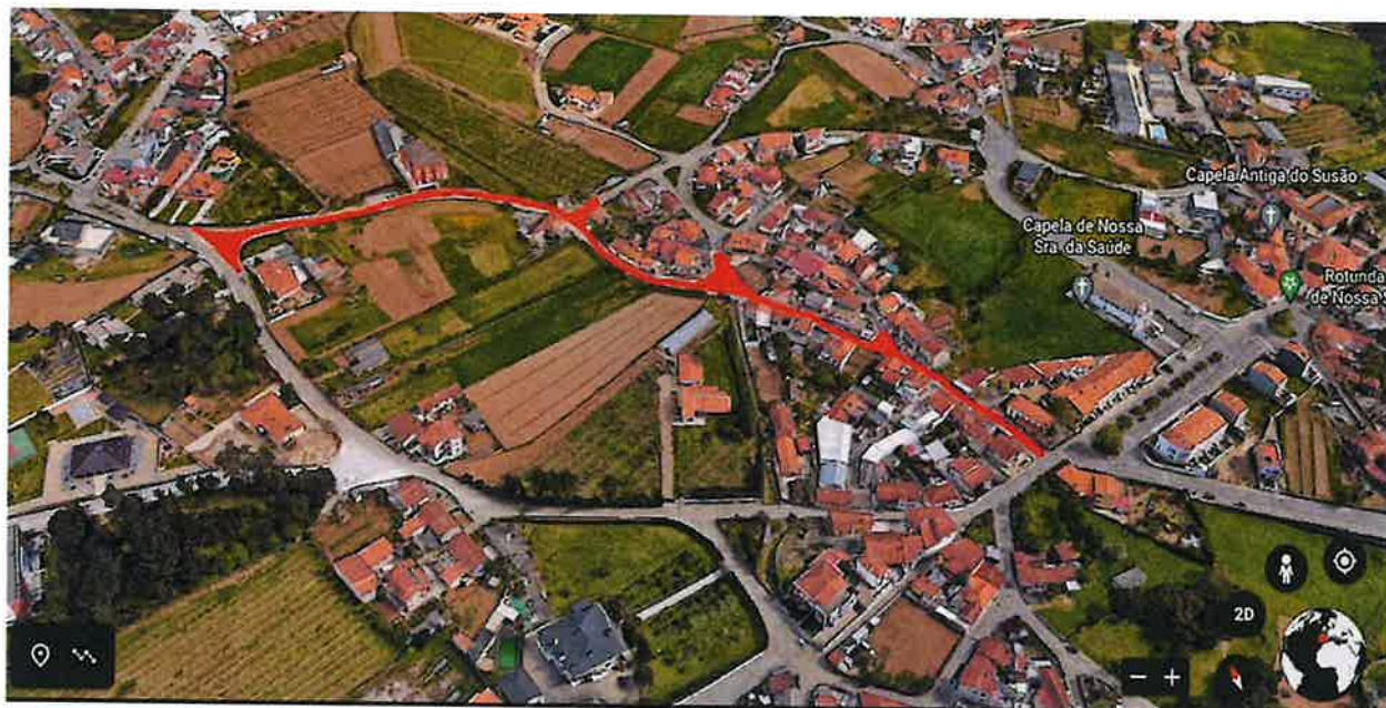
Localização obra – Rua André Gaspar